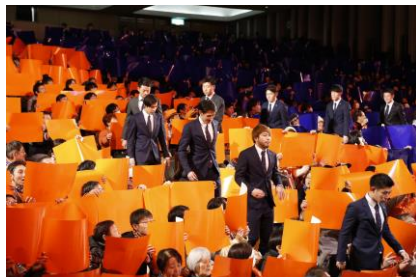
～選手をコレオボードで激励～