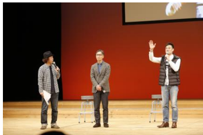
～第一部トークイベント～